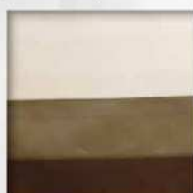
Contrasti (doppio bordo applicato)