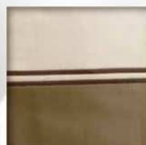
Doppio bourdon (bordo applicato e due bourdon)