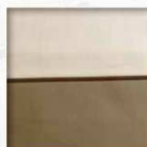
Essenzial (bordo applicato e bourdon)