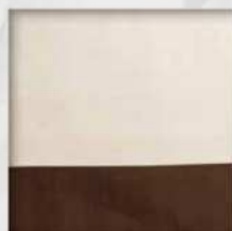
Bordo applicato (cucitura semplice con bordo)