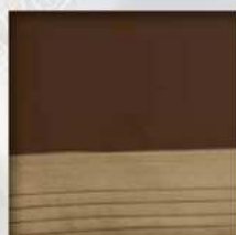
Piccole emozioni (plissé a cucitura piedino)