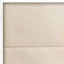
Cristine (orlo a jour o bourdon)