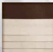
Emozioni ( a misura)