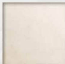
Semplice - contract (orlo a cucitura semplice)