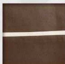
Bicolor (profilo inserito nel bordo)